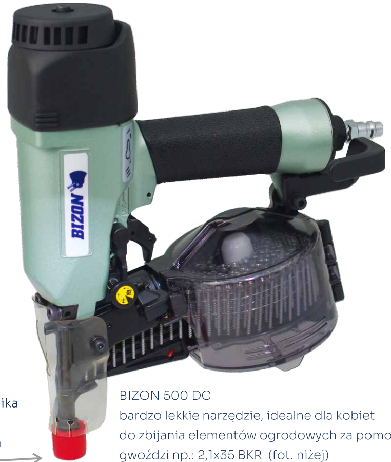
BIZON 500 DC

bardzo lekkie narzędzie, idealne dla kobiet do zbijania elementów ogrodowych za pomocą gwoździ np.: 2,1x35 BKR (fot. niżej)