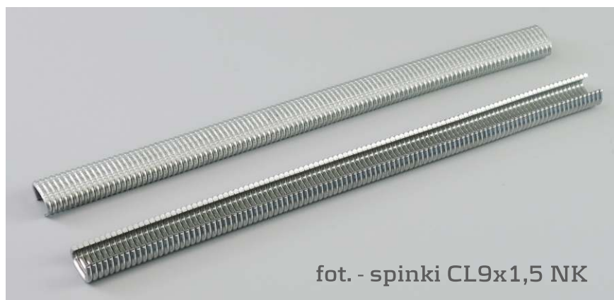
fot. - spinki CL9x1,5 NK