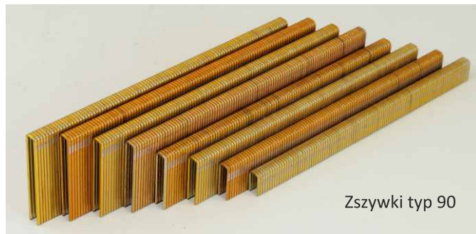
Zszywki typ 90

DP – rozprężne z ostrzem ściętym w dwóch kierunkach