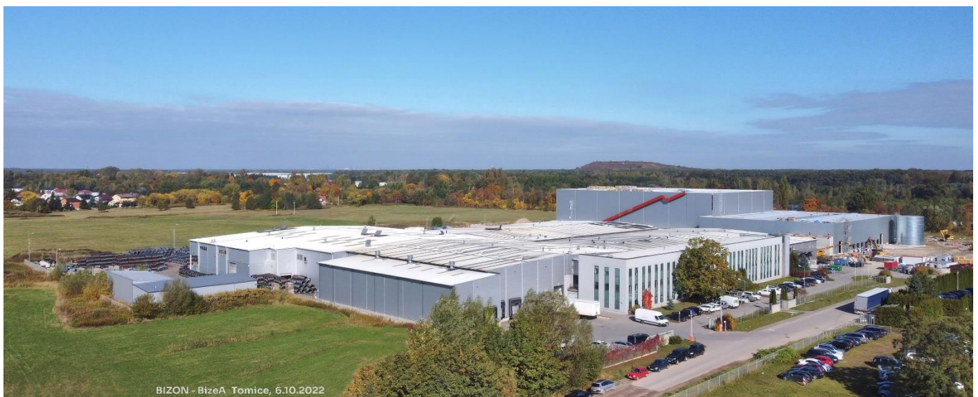
BIZON - BizeA Tomice, 6.10.2022

BIZON INT produkuje zszywki od 1985 roku, obecnie również produkuje druty stalowe, wkręty, sztyfty i gwoździe oraz inne elementy złączne.