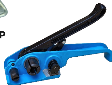
Napinacz taśmy PP

Zapinki do taśmy PP, które utrzymują jej prawidłowy naciąg.